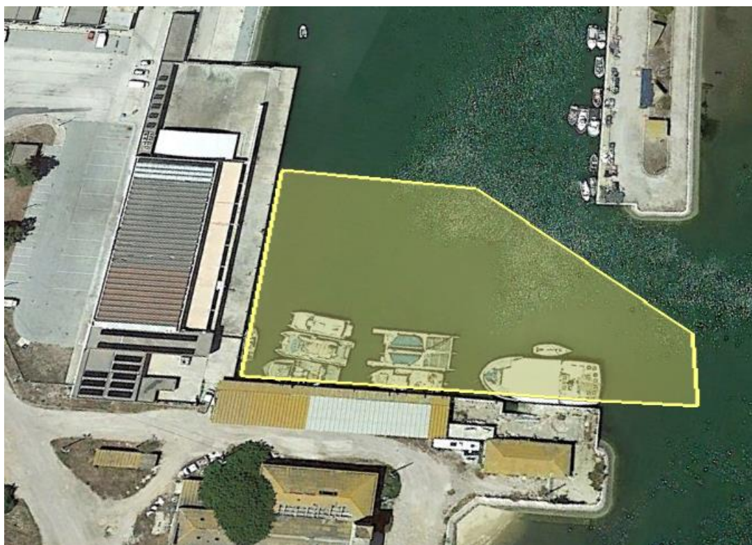
Fig.1 - Representação da zona prevista de dragagem no Porto de Pesca de Vila Real Santo António

A Seaculture - Aquicultura S.A., pretende realizar dragagens de manutenção na zona sul do Porto de Pesca de Vila Real de Santo António, numa área aproximada de 120mx60m, confinante com o acesso ao mesmo, conforme ilustrado abaixo, com vista à reposição da cota -2,50 m (ZH), cota imprescindível para a navegação das embarcações afetas às atividades de pesca e aquacultura.